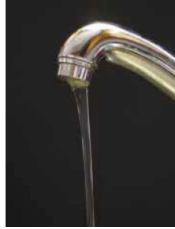
Figura 2: Grifo de cocina.